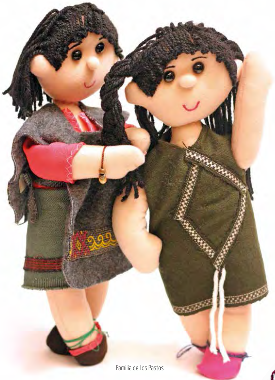
Familia de Los Pastos